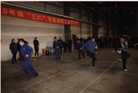
迎“三八”系列职工体育比赛之绳键接力。