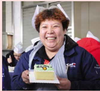
精美的蛋糕做好了,真开心。