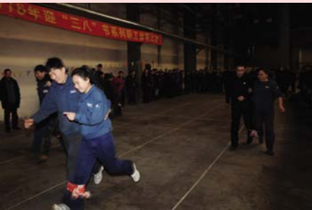
迎“三八”系列职工体育比赛之“两人三足”。