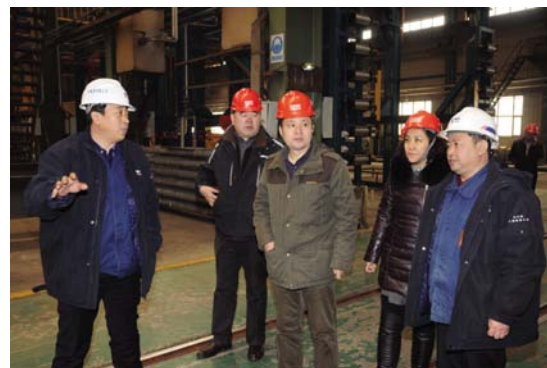
(图为公司领导陪同大件公司客人在制造分厂参观。)

本报讯(通讯员张印明)3月9日,中铁特货公司及其所属大件公司领导及有关部门人员,到公司就特种车新产品研发、造修基地建设、造修实际情况以及扣车交付等工作进行深入调研。