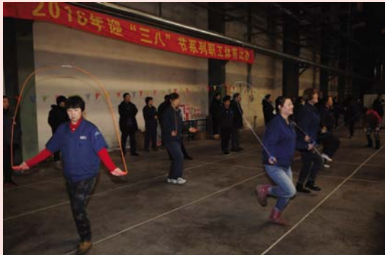
迎“三八”系列职工体育比赛之跳绳。