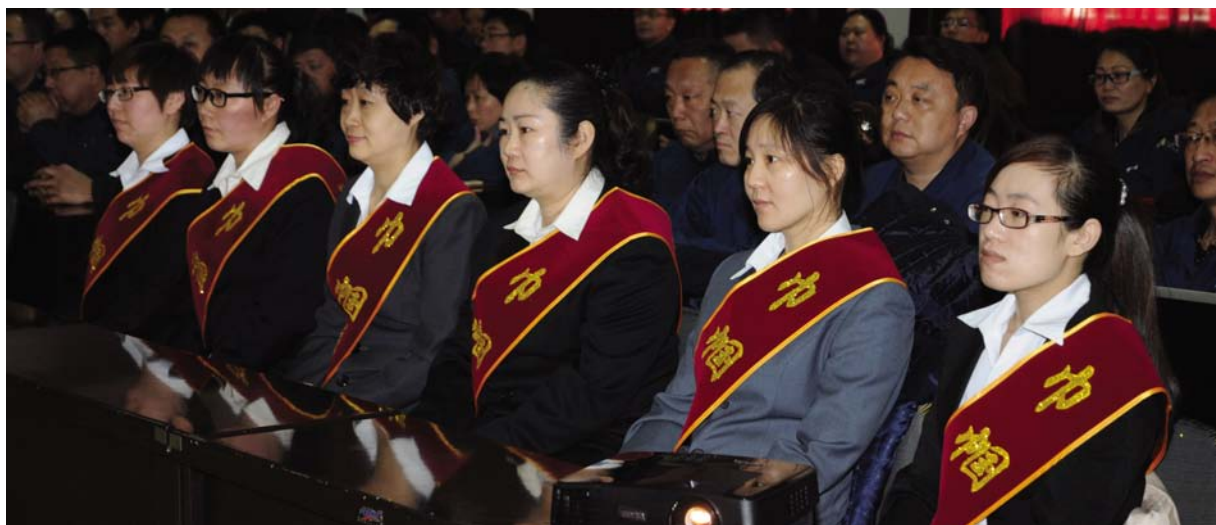
(图为公司 2015 年度“巾帼标兵”在表彰会上。)

本报讯(记者崔新峰)为隆重纪念“三八”国际劳动妇女节,凝聚女职工力量,激励女职工继续发挥“半边天”作用,为公司发展壮大再立新功,3月10日下午,公司在主楼五楼会议室召开 2015 年度巾帼建功先进集体、先进个人表彰大会。董事长、总经理景丹,党委书记闫玉贵,党委副书记、纪委书记、工会主席赵刚,副总经理黄玉山、徐建民、曹青海,总工程师阴雷、总会计师张召玉等公司领导及各单位党政工领导、先进女职工代表共计 100 余人参加了会议。会议由女工委主任金可欣主持。