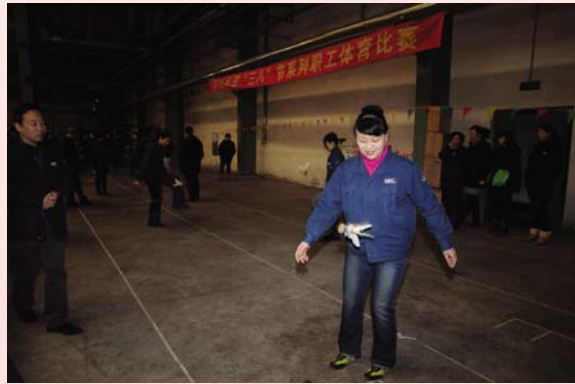
迎“三八”系列职工体育比赛之踢毽子。